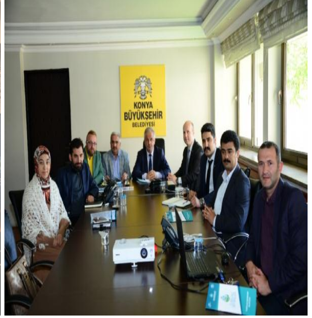
İklım Deęiřiklięiyle M¼cadelede Yerel Y¼netimler Bileřeni Semineri - Konya