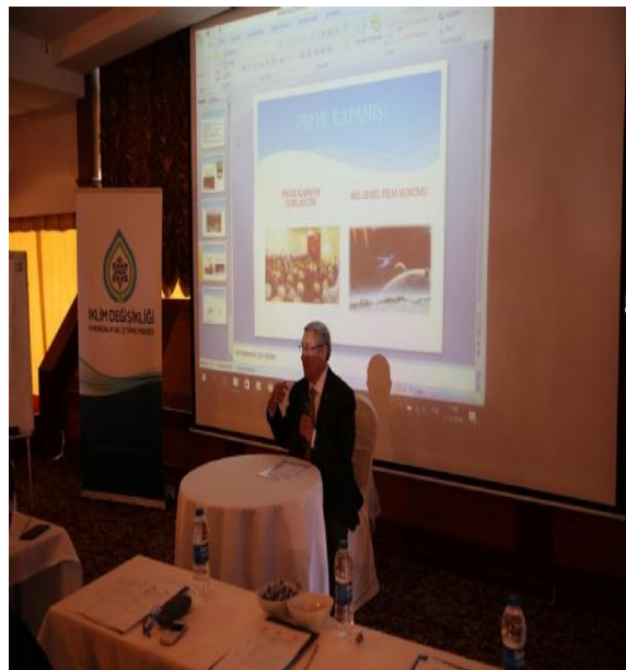
İklım Deęiřiklięiyle M¼cadelede Yerel Y¼netimler Bileřeni Semineri - Antalya